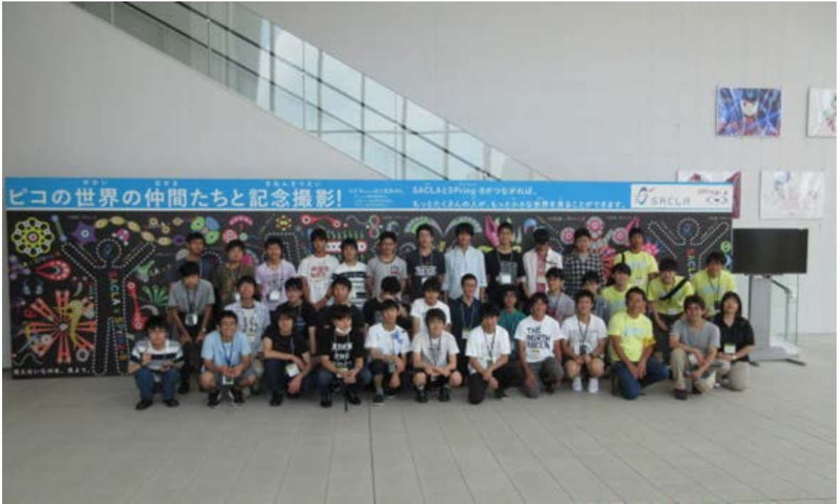
場所：SACLA 実験研究棟エントランス